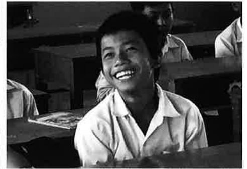
保健教育を実施している中学校 (カンボジア)

現地の人々や団体と協力して活動内容や目標を決め、保健医療活動を行っています。現在、カンボジア、ケニア、タンザニアで協働プロジェクトを実施しています。