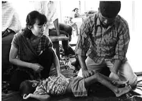
現地のスタッフを指導する日本人理学療法士 (バングラデシュ)

アジア・アフリカ諸国に、医師や看護師、理学療法士などの保健医療従事者を派遣しています。派遣された保健医療従事者は、健康といのちを守る活動をしています。