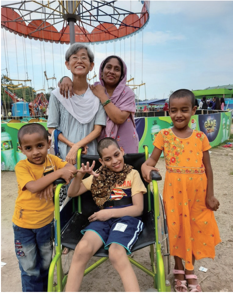
障がいのある子どもを支援する看護師 (バングラデシュ)

クリスチャンの医師や看護師など保健医療従事者（ワーカー）を、アジア・アフリカの国々に派遣しています。ワーカーは地域の人々と共に生き、その地域の保健医療従事者を育てています。地域の人々が自らの手で健康をまもっていけるようになることをめざしています。