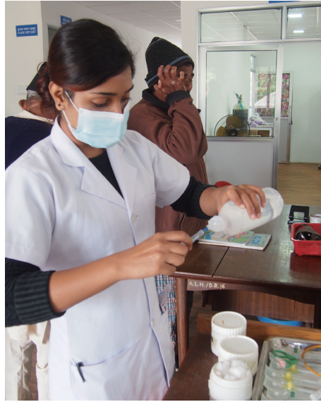
JOCS奨学金で学んだ看護師（ネパール）

保健医療サービスが十分ではない地域で、弱い立場におかれた人々のために働きたいと願う保健医療従事者を、奨学金で支援しています。研修の機会を提供することで、その地域の保健医療従事者の育成と、保健医療レベルの向上に協力しています。